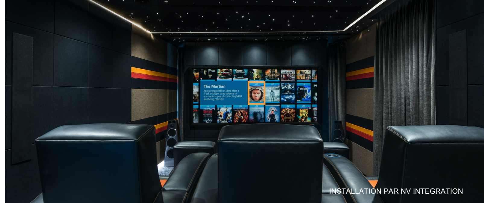
INSTALLATION PAR NV INTEGRATION