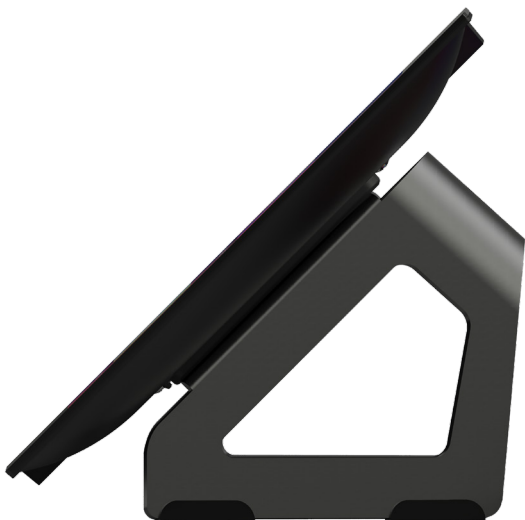
Le support de table est vendu séparément