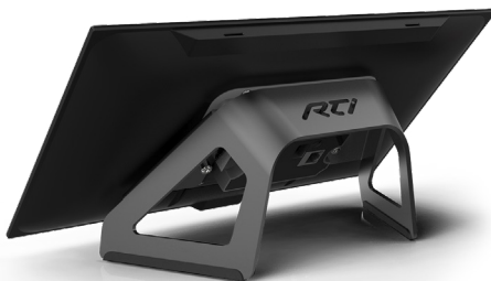
Installation sur comptoir avec support de table