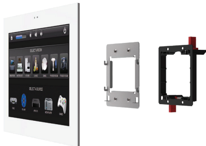
L'installation murale utilise un support mural et un adaptateur