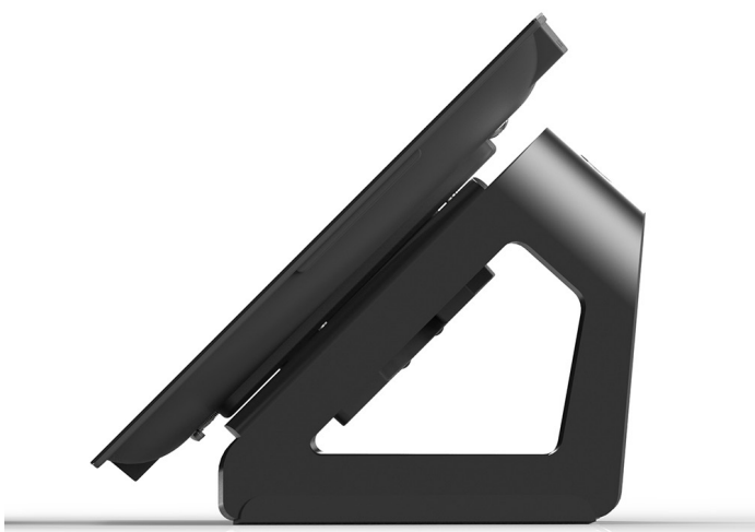
Le support de table est vendu séparément