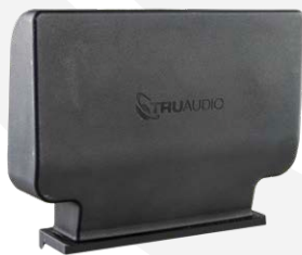
TREMOR-EXT +3dB en sortie