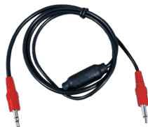
IRC-SM12V Câble adaptateur infrarouge pour VIP-UHD-TX et VIP-UHD-RX