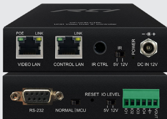
VIP-UHD-CTRL Vidéo over IP Module de contrôle