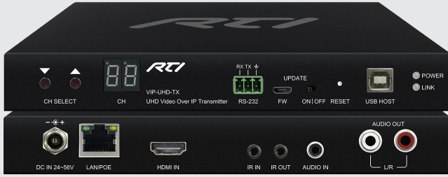
VIP-UHD-TX 4K Video over IP Transmetteur